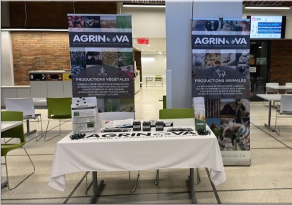
Université Laval Salon de l'emploi - Janvier 2024