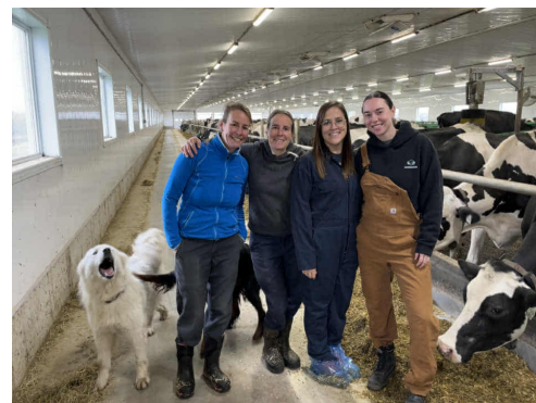
PROJET « FERTILITÉ ET RENTABILITÉ DES VACHES LAITIÈRES »

C'est ce qu'a permis d'examiner une étude menée en collaboration avec AgriNova - CCTT auprès de 12 fermes laitières du Québec. Technologies 4.0, données massives, conciliation travail-famille, gestion des maladies animales : l'objectif était de mieux comprendre ce qui fonctionne réellement, et dans quelles conditions.