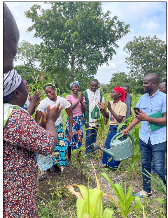
PROJET « SEMER POUR DEMAIN » AU BÉNIN EN COLLABORATION AVEC LE CENTRE DE SOLIDARITÉ INTERNATIONALE